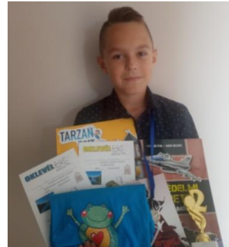
Városi Nimród, Csuhá Antal Baptista Általános Iskola, Gimnázium, Technikum és Szakképző Iskola, Nagyhalász